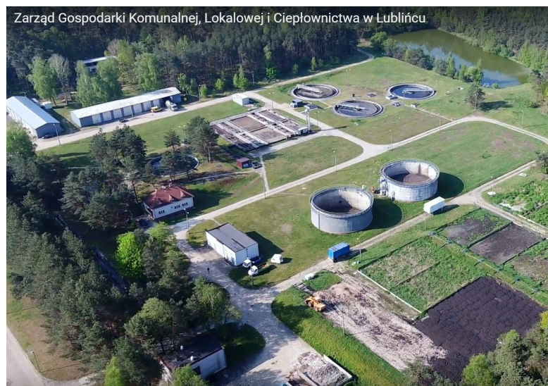
Zarząd Gospodarki Komunalnej, Lokalowej i Ciepłownictwa w Lublińcu

Link: https://lubliniec.eu/index.php/fundusze/modernizacja-oczyszczalni-sciekow/1912-poiis-2014-2020.html