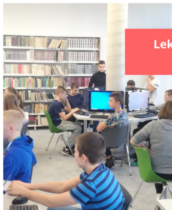
Lekcje biblioteczne dla uczniów z Lublińca i powiatu