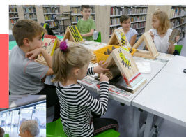
Odwiedziny przedszkolaków z Lublińca i powiatu