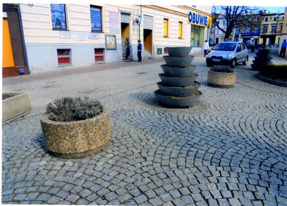
Stan obecny Małego Rynku