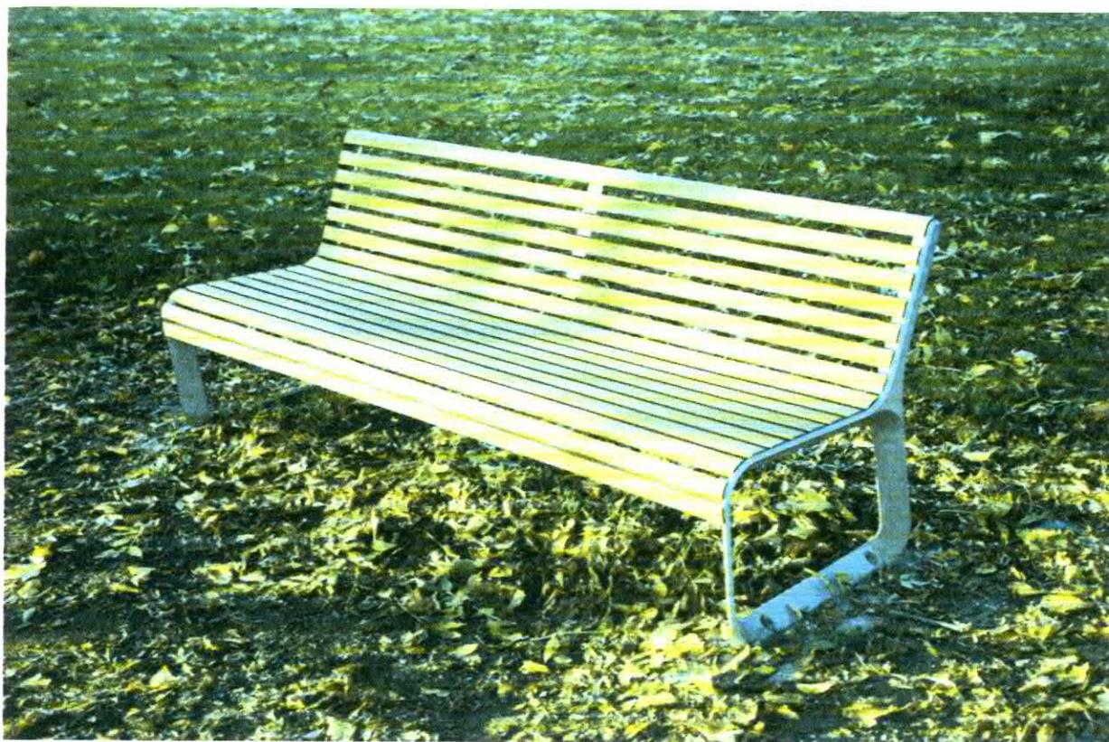
Fotografia nr 1