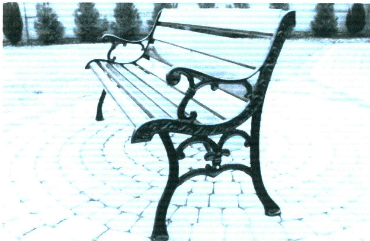
Fotografia nr 3