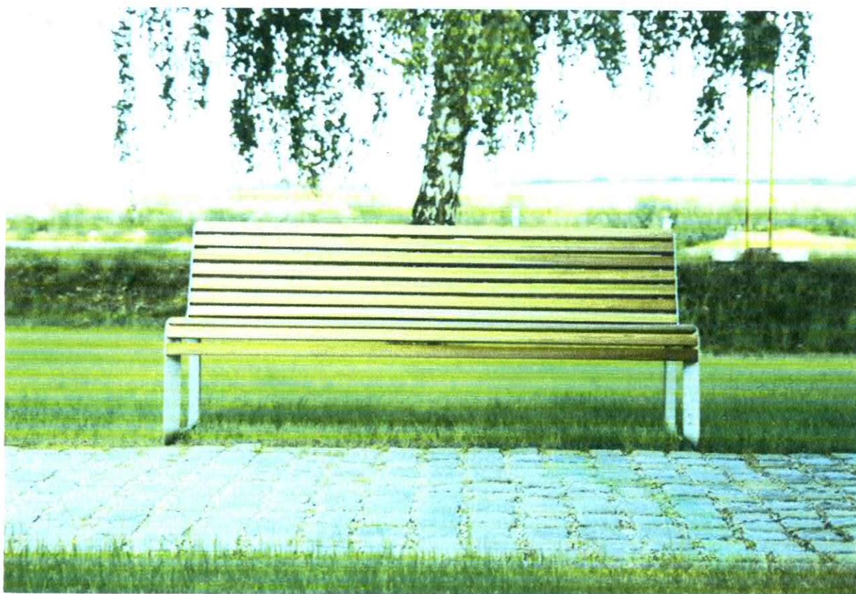
Fotografia nr 2