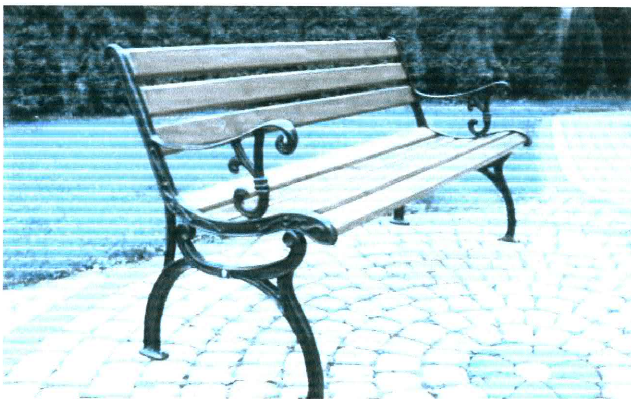
Fotografia nr 4