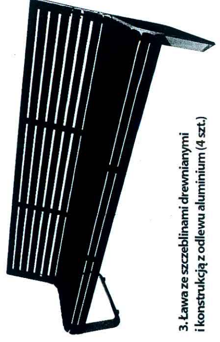
3. Ława ze szczepelinami drewnianymi i konstrukcją z odlewu aluminium (4 szt.)