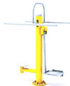
+ Twister z wahadłem

Sześć urządzeń, osiem stanowisk do ćwiczeń, cena tylko