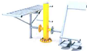
+ Ławka z prostownikiem