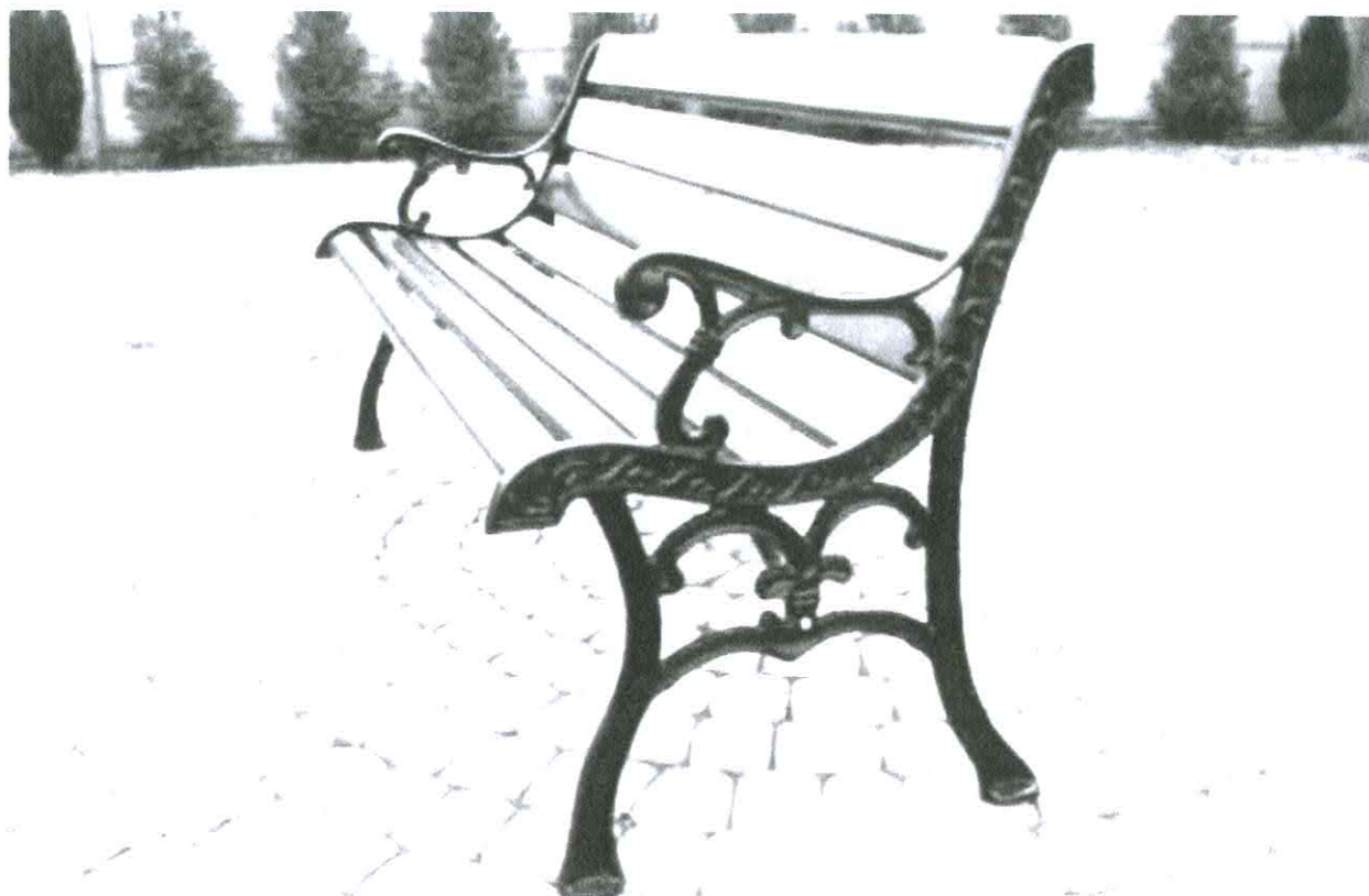
Fotografia nr 3