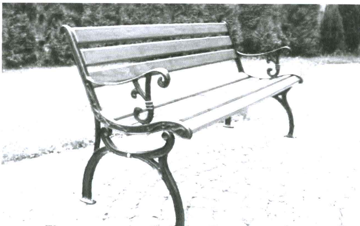
Fotografia nr 4