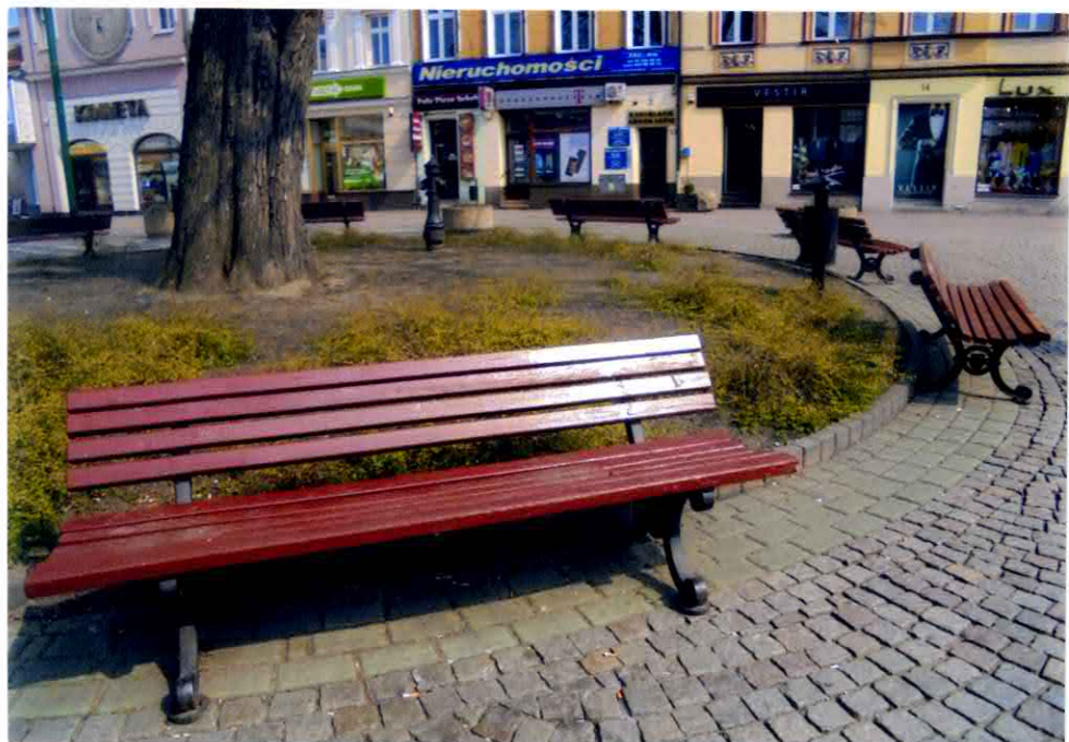
Stan obecny ławek