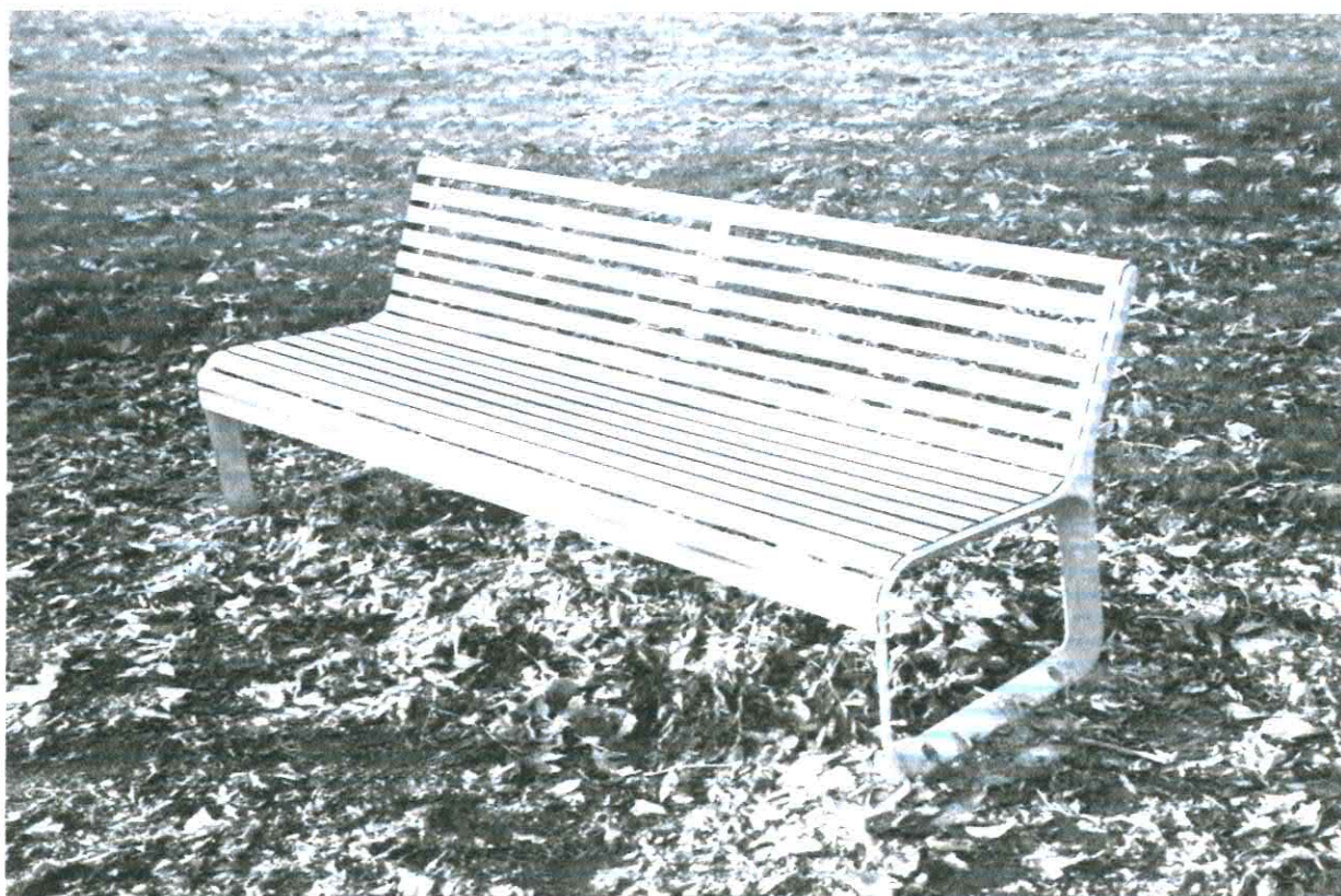
Fotografia nr 1