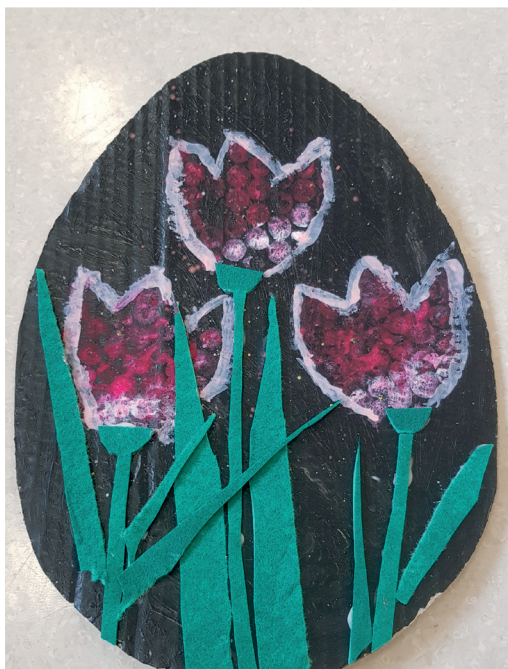
I MIEJSCE / PRZEDSZKOLE Milena Kubica, 7 lat, Przedszkole Miejskie nr 7 w Lublińcu

Wyróżnienie – Milena Grabińska, 6 lat, Przedszkole Pluszowego Misia w Pawonkowie