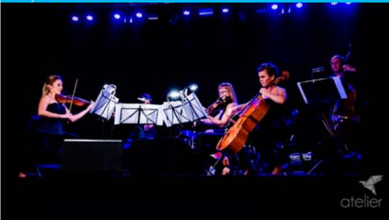
Koncert APERTUS QUARTET