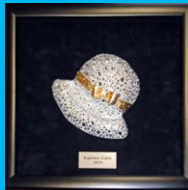
KAPELUSZ EDYTY wykonany przez lubliniecką artystkę Annę König