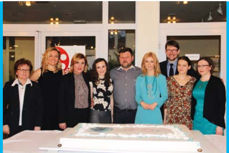
Organizatorzy II Lublinieckiej Gali „Być kobietą” z okolicznościowym tortem przygotowanym przez Piekarnię KAMPA