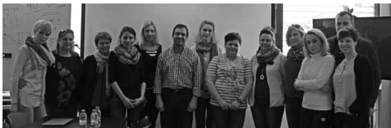
Gimnazjum nr 2 im. Jana Pawła II w europejskiej mobilności w Lizbonie.