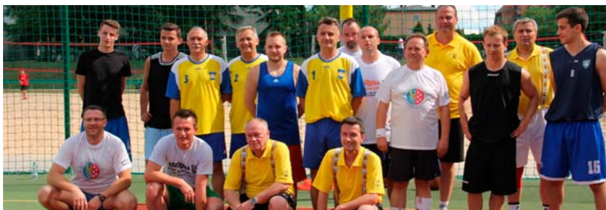
Delegacje miast partnerskich: Łowicza, Redy i Kravare.