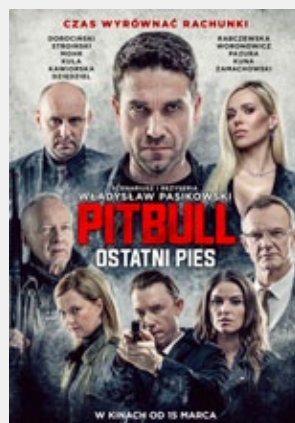
„PITBULL. OSTATNI PIES”

2D dubbing, gatunek: animacja, familijny, prod. Dania, Niemcy, Luksemburg, b/o Seanse: 27,30 IV, 1 V godz. 17:00; 28,29 IV godz. 15:00 Bilety: 16 zł normalny, 14 zł ulgowy