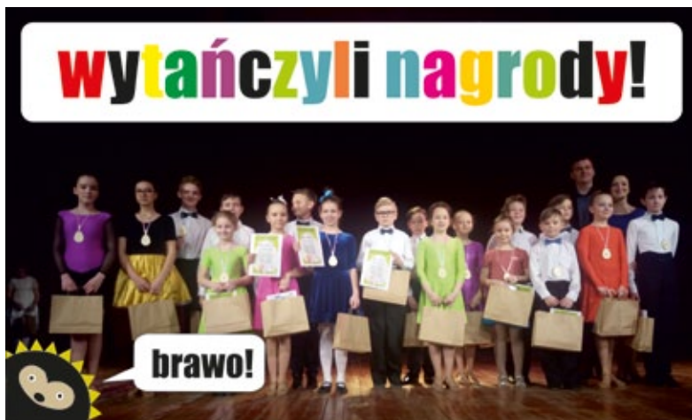
SUKCES SEKCJI TAŃCA TOWARZYSKIEGO