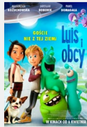
„LUIS I OBCY”

2D napisy, gatunek: dramat, polityczny, prod. USA, od lat 12 Seanse: 13–15 IV godz. 19:00; 16,17 IV godz. 17:00 Bilety: 16 zł normalny, 14 zł ulgowy