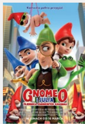
„GNOMEO I JULIA. TAJEMNICA ZAGINIONYCH KRASNALI”

gatunek: sensacyjny, prod. Polska, od lat 15 Seanse: 3 IV godz. 19:00, 6–10 IV godz. 17:50, 20:10 Bilety: 16 zł normalny, 14 zł ulgowy