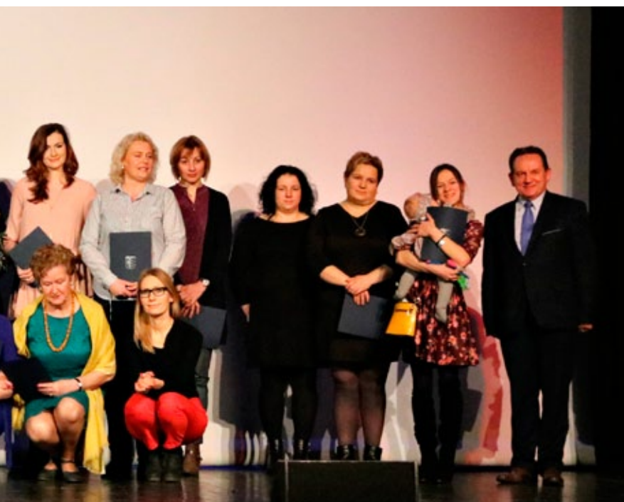
Prezyskie Lublinieckiej Rady Kobiet