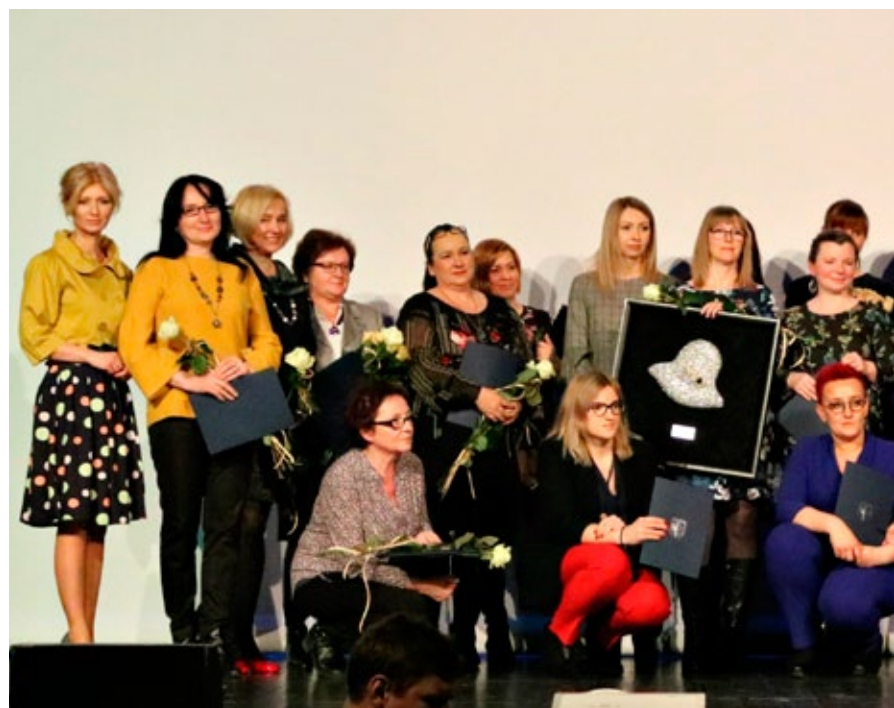
Panie nominowane do Kapelusza Edyty 2018 oraz członkinie Rady Kobiet