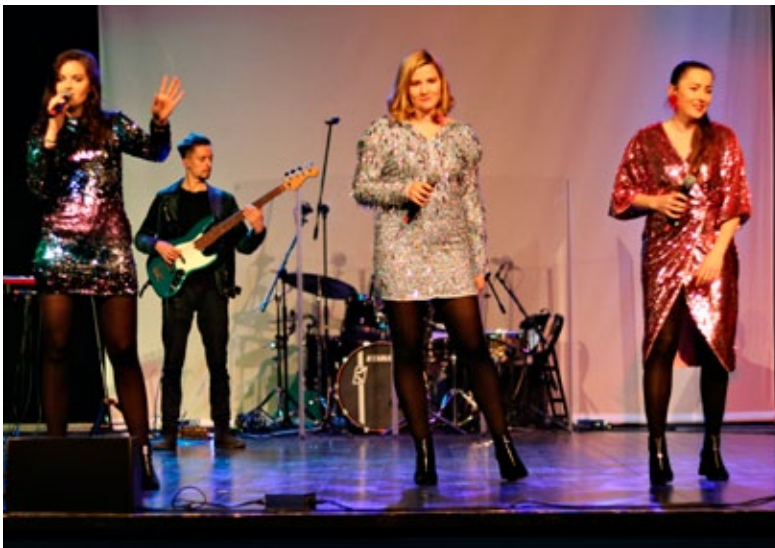
Zespół FRELE