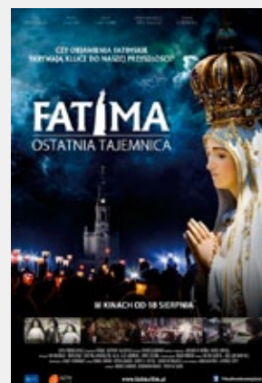
„FATIMA. OSTATNIA TAJEMNICA”

2D dubbing, gatunek: animacja, familijny, prod. USA, Wielka Brytania, b/o Seanse: 20–24 IV godz. 17:00; 21–22 IV godz. 15:00 Bilety: 16 zł normalny, 14 zł ulgowy