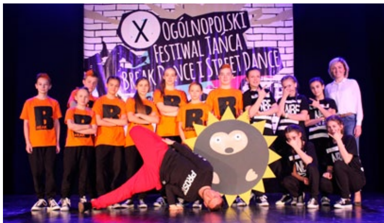
BREAK DANCE I STREET DANCE W MDK

w Częstochowie, w którego kręgu zainteresowań jest polska literatura najnowsza, zwłaszcza poezja. Serdecznie gratulujemy laureatom! Lista nagrodzonych na www.mdk.lubliniec.pl .