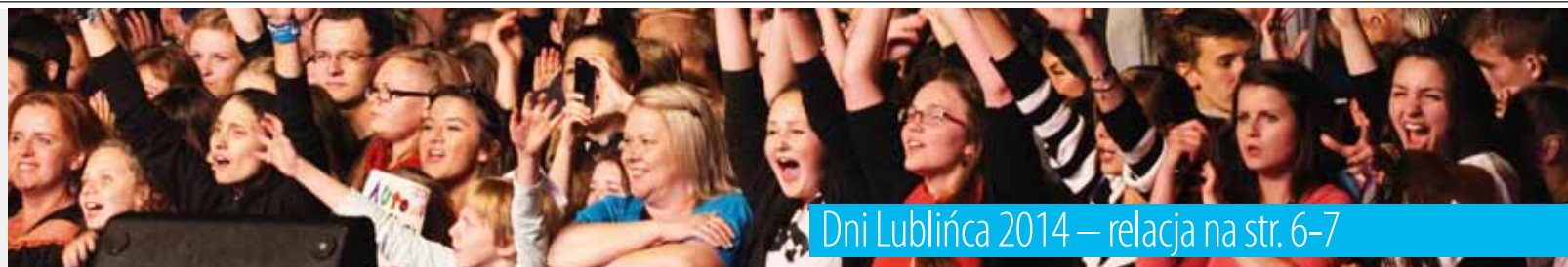
Dni Lublińca 2014 – relacja na str. 6-7