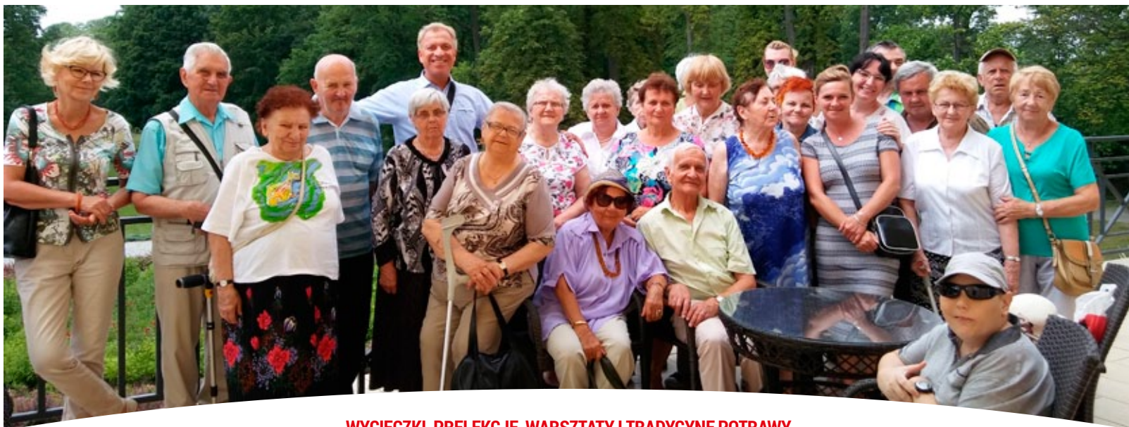
WYCIEZKI, PRELEKCJE, WARSZTATY I TRADYCYJNE POTRAWY