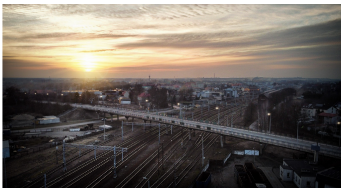
Wiadukt przed rozbiórką, luty 2023 r.

Budowa nowego wiaduktu w ciągu ul. Powstańców Śląskich Inwestycję realizuje Zarząd Dróg Wojewódzkich w Katowicach. Wykonawcą prac jest firma Banimex Sp. z o.o. z Będzina. Dofinansowanie z programu Polski Ład. Wartość dofinansowania: 30 000 000,00 zł. Całkowita wartość zadania: 41 885 308,39 zł. Umowny termin zakończenia robót budowlanych: 22 lutego 2025 r.