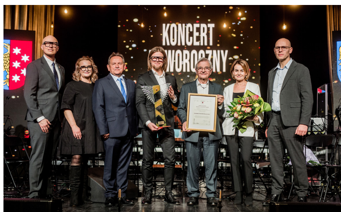
Ambasador Miasta 2025: firma Elhand Transformatory Sp. z o.o.