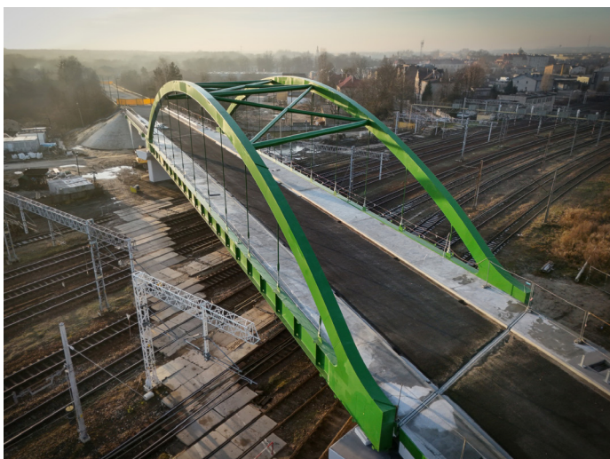
Styczeń 2025 r., fot.: Oczy Otwarte - Łukasz Karnatowski

Budowa sieci kanalizacji sanitarnej wraz z oczyszczalnią ścieków w Kokotku Wartość inwestycji: 12 261 953,43 zł. Dofinansowanie z Rządowego Funduszu Inwestycji Lokalnych w wysokości: 1 640 000,00 zł. Zadanie zakończone.