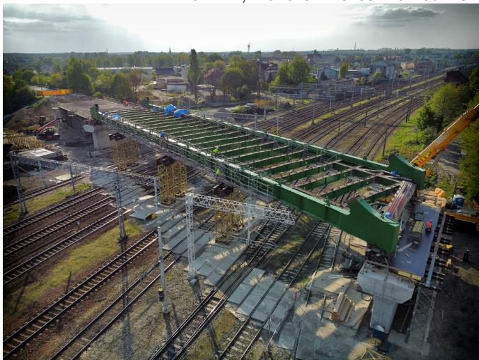
Maj 2024 r., fot.: Oczy Otwarte - Łukasz Karnatowski