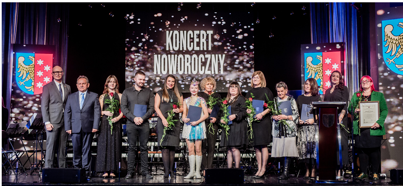
Laureaci tegorocznej Nagrody Burmistrza Miasta Lublińca w dziedzinie kultury