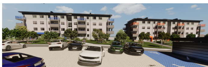
WIDOK OD UL. PLK. WACŁAWA WILNIEWCZYCA