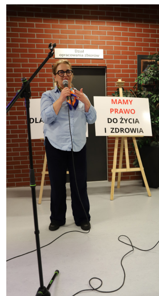
Iwona Janic - przewodnicząca Rady Miejskiej w Lublińcu