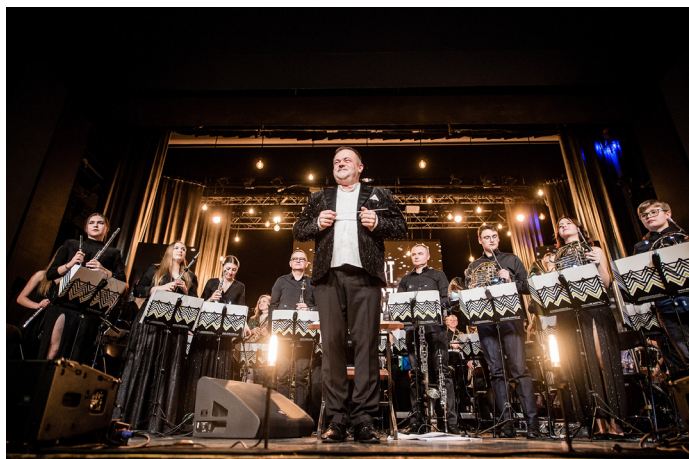
Miejska Orkiestra Dęta Lubliniec