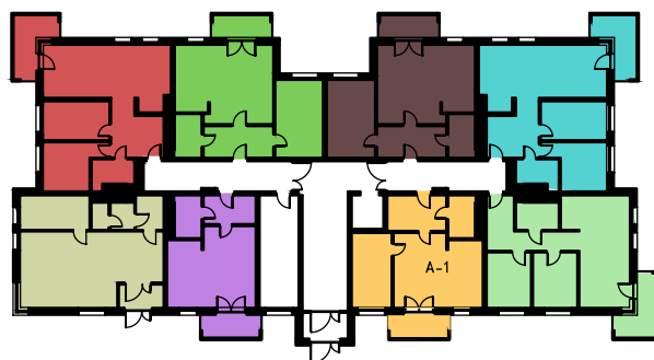
lokalizacja mieszkań - parter

Budynki mieszkalne wyposażone są w windy, które ułatwią poruszanie się osobom starszym i niepełnosprawnym. W każdym budynku przewidziano 6 garaży w poziomie piwnic (łącznie 12 garaży), które będą wynajmowane odpłatnie oraz 85 bezpłatnych miejsc postojowych naziemnych przewidzianych dla najemców mieszkań. W piwnicach zlokalizowano również 62 komórki lokatorskie, po jednej komórce dla każdego mieszkania. Komórki lokatorskie nie są zaliczane do powierzchni użytkowej mieszkania, a tym samym ich użytkowanie jest bezpłatne.