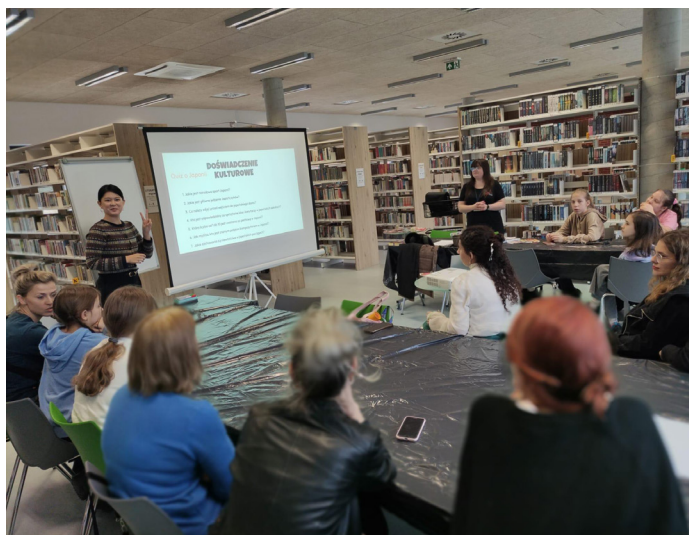
Warsztaty „Kultura Świata: Kaligrafia, Zabawa i Smaki Japonii” prowadzone przez rdzenną Japonkę ze Szkoły Artystyczno-Językowej KAMELEON.