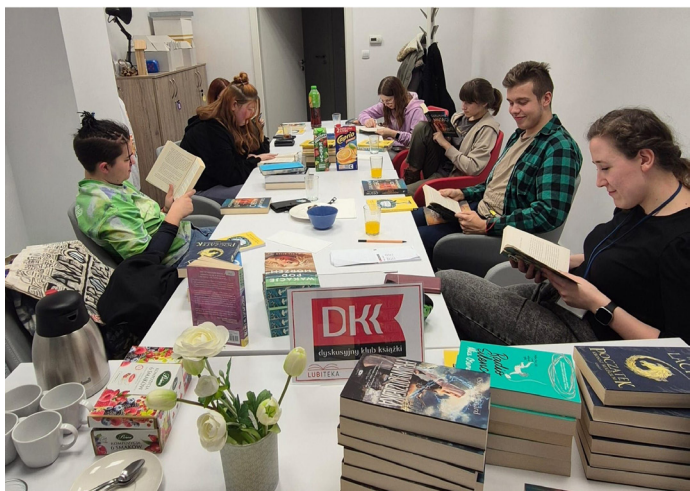
Dyskusyjny Klub Książki „Czytomania”