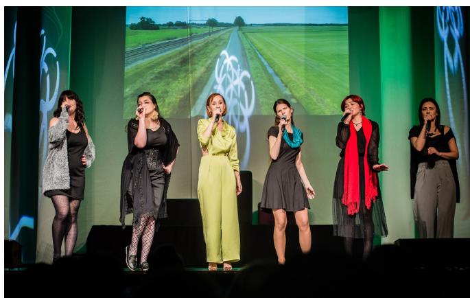
Recital Teatru po Pracy „Kobiety, których nie ma”