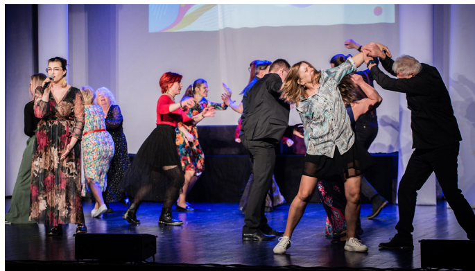
Recital Teatru po Pracy „Kobiety, których nie ma”