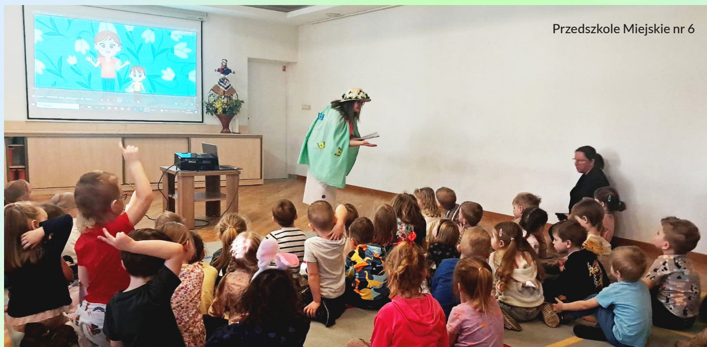
Przedszkole Miejskie nr 6