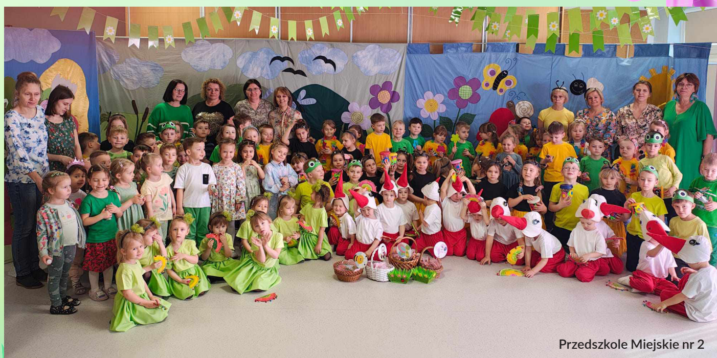
Przedszkole Miejskie nr 2