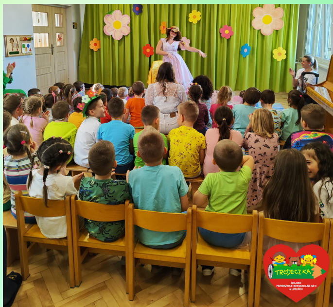
Miejskie Przedszkole Integracyjne nr 3