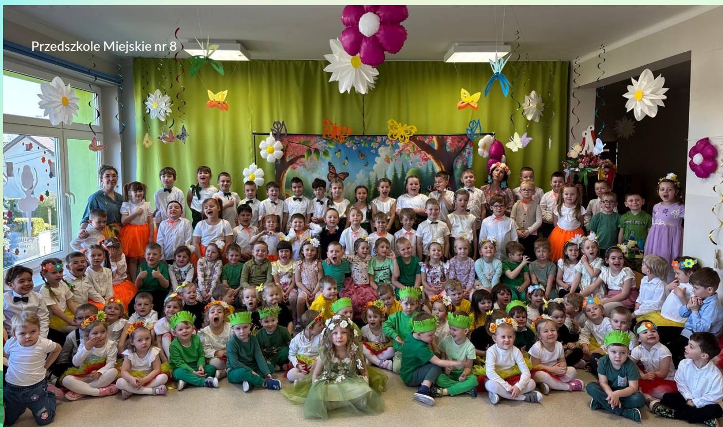
Przedszkole Miejskie nr 8