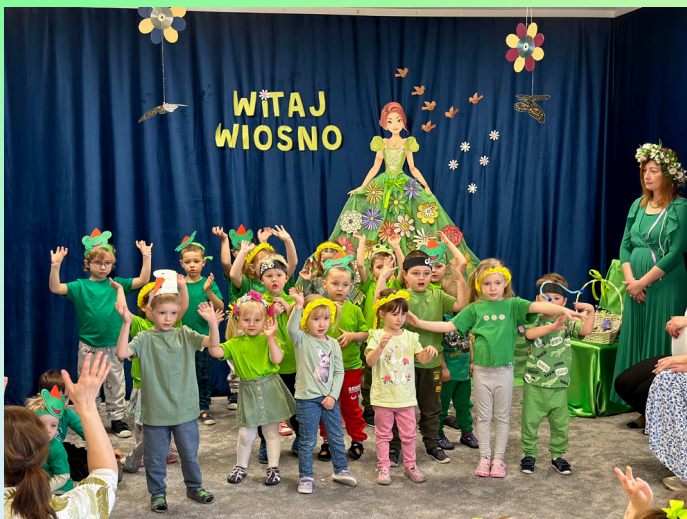
Przedszkole Miejskie nr 1