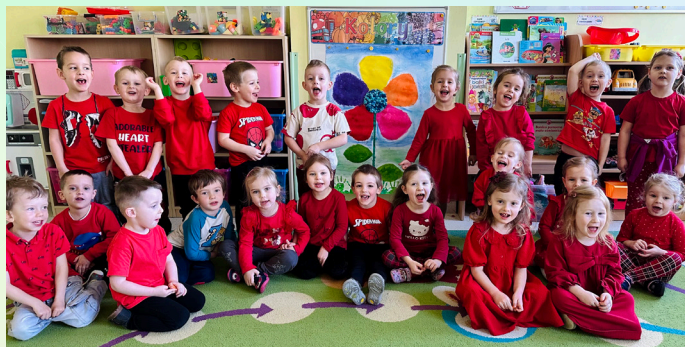
Przedszkole Miejskie nr 4