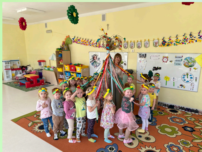
Przedszkole Miejskie nr 7