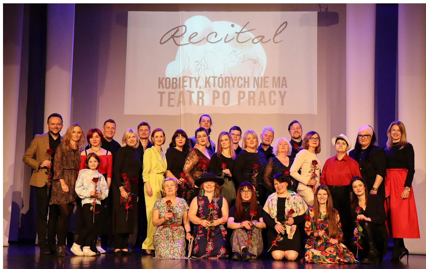
Recital Teatru po Pracy „Kobiety, których nie ma”, fot. Daniel Dmitriew