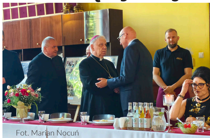
Fot. Marian Nocuń