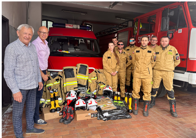
Budżetu Obywatelskiego na rzecz bezpieczeństwa mieszkańców Lublińca.

Zakupione wyposażenie zwiększy bezpieczeństwo strażaków podczas działań ratowniczo-gaśniczych oraz przyczyni się do podniesienia gotowości operacyjnej jednostki. Projekt jest kolejnym przykładem skutecznego wykorzystania środków